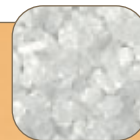
Corindone bianco White Corundum